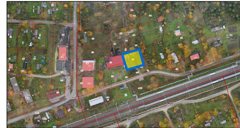
- место расположения земельного участка